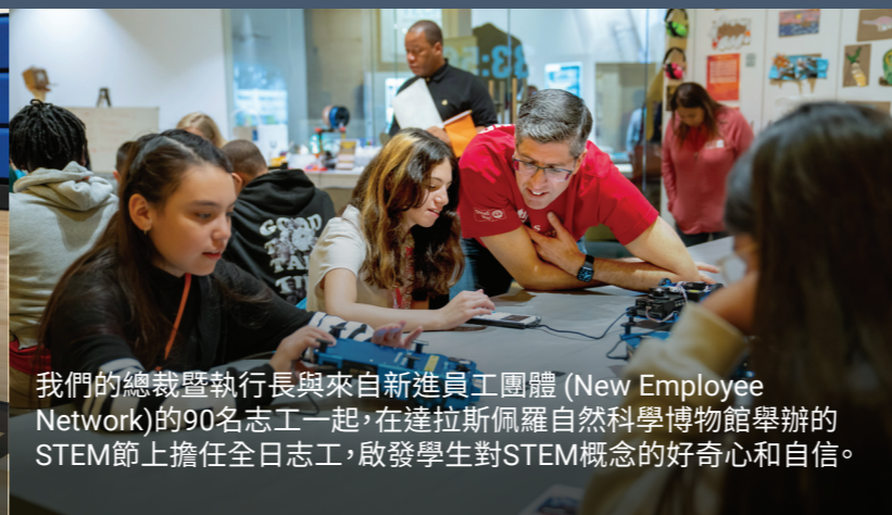
我們的總裁暨執行長與來自新進員工團體 (New Employee Network) 的90名志工一起，在達拉斯佩羅自然科學博物館舉辦的STEM節上擔任全日志工，啟發學生對STEM概念的好奇心和自信。