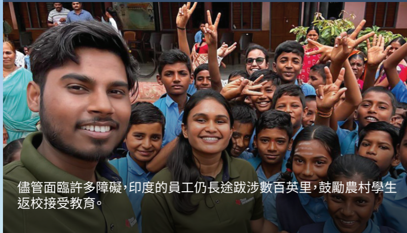
儘管面臨許多障礙，印度的員工仍長途跋涉數百英里，鼓勵農村學生返校接受教育。