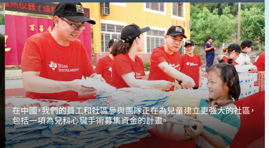
在中國，我們的員工和社區參與團隊正在為兒童建立更強大的社區，包括一項為兒科心臟手術募集資金的計畫。