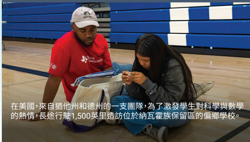
在美國，來自猶他州和德州的一支團隊，為了激發學生對科學與數學的熱情，長途行駛1,500英里造訪位於納瓦霍族保留區的偏鄉學校。