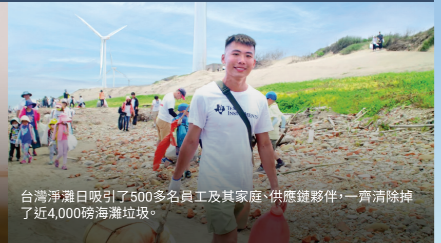
台灣淨灘日吸引了500多名員工及其家庭、供應鏈夥伴，一齊清除掉了近4,000磅海灘垃圾。