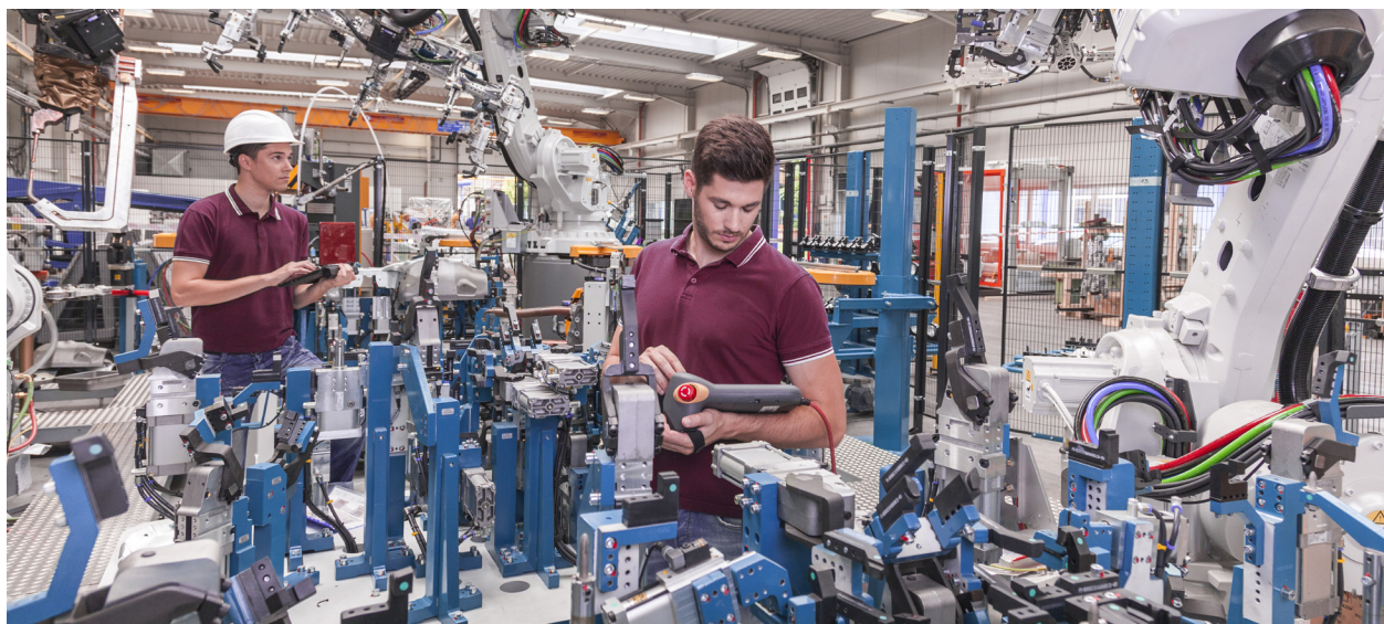
图 2. 协作机器人在工厂环境中与人类一起工作。

物流机器人是在可能有人在场或不在场的环境(例如仓库、配送中心、港口或园区)中工作的移动装置。物流机器人取回货物并将其带到包装站,或者将货物从公司现场的一处建筑物运到另一处;有些物流机器人也可以提取和包装货物。这些机器人通常在特定环境